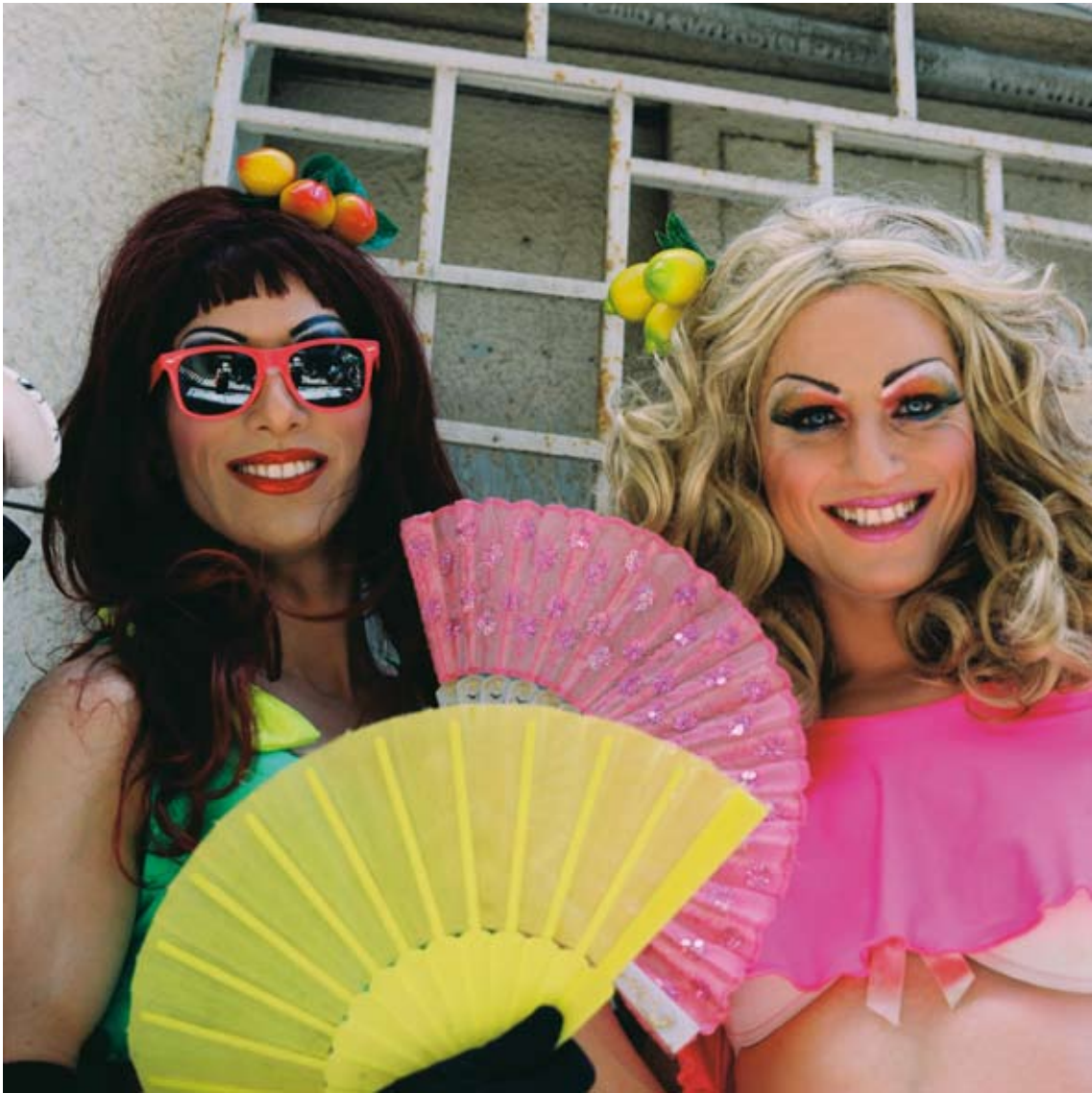
Tami Notsani Sans titre / Untitled , 2011