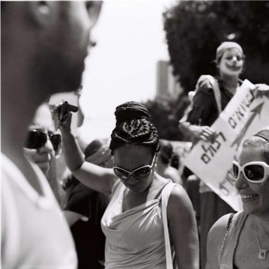
Tami Notsani Sans titre / Untitled, 2011