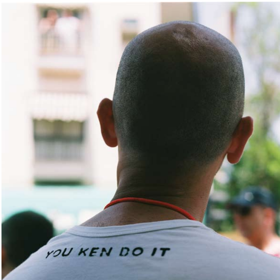
Tami Notsani Sans titre , 2011