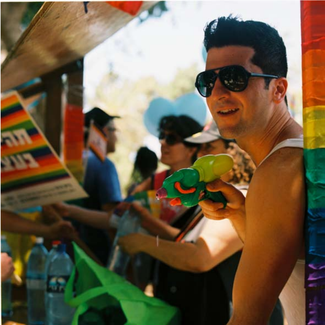
Tami Notsani Sans titre / Untitled, 2011