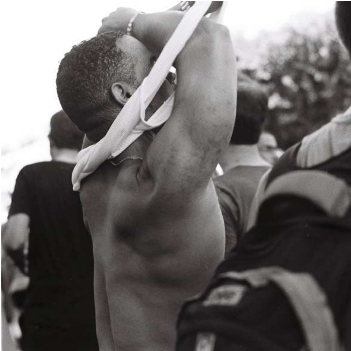
Tami Notsani Sans titre / Untitled , 2011