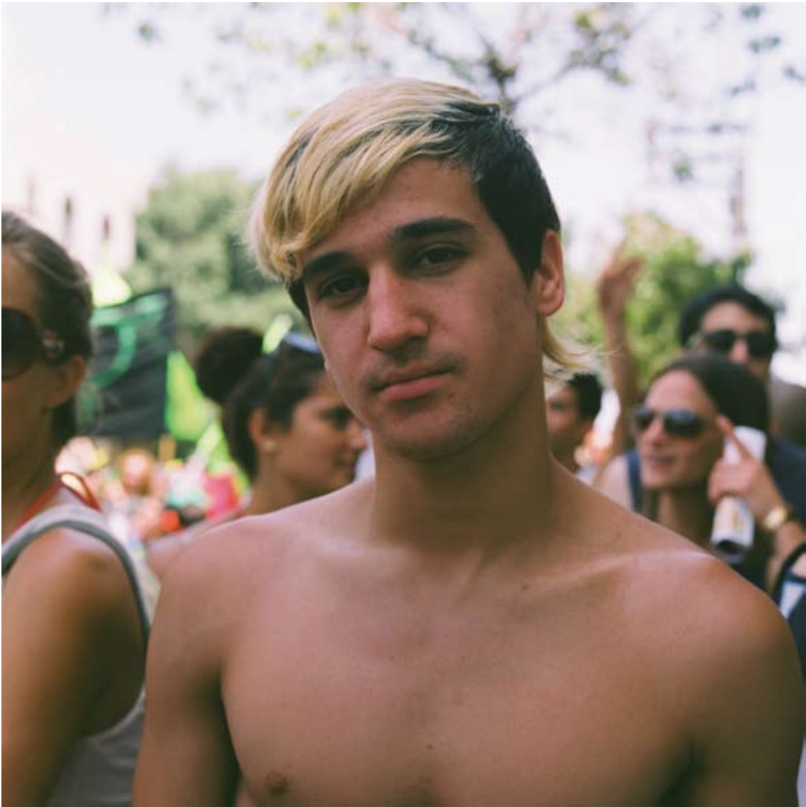
Tami Notsani Sans titre / Untitled , 2011