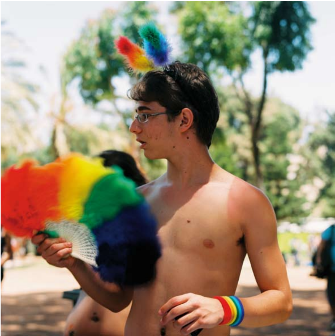
Tami Notsani Sans titre / Untitled, 2011