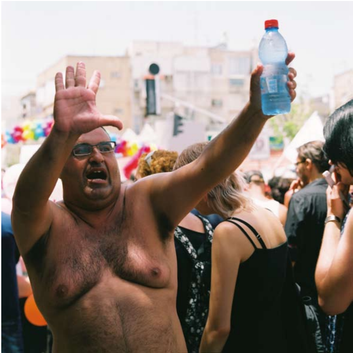
Tami Notsani Sans titre / Untitled , 2011