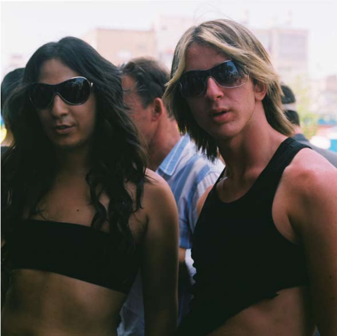
Tami Notsani Sans titre / Untitled, 2011