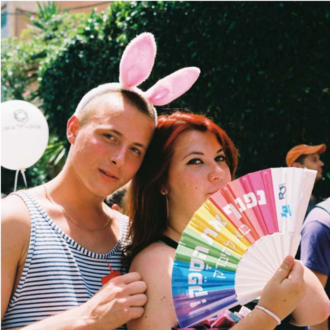
Tami Notsani Sans titre / Untitled, 2011