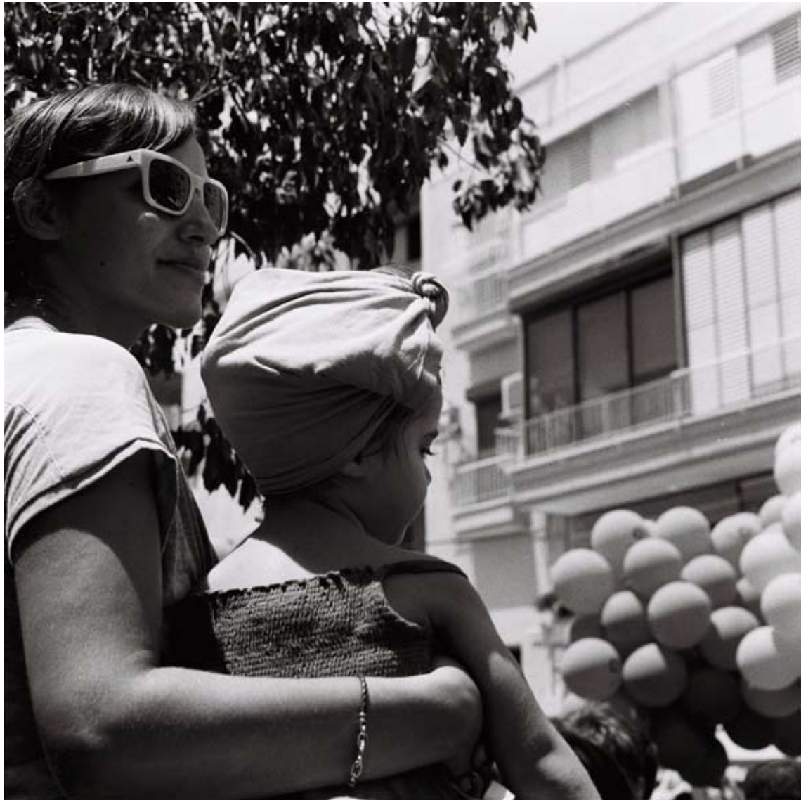
Tami Notsani Sans titre / Untitled, 2011